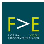
Forum voor Erfgoedverenigingen