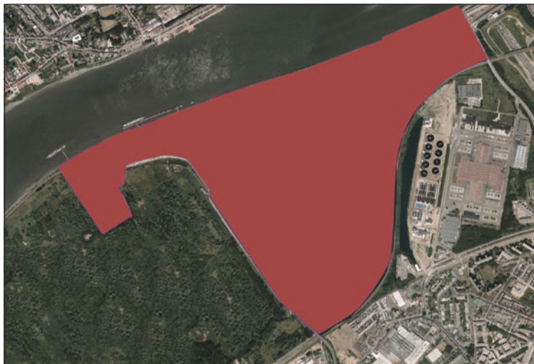
Le site de Petroleum Zuid fera l'objet d'un développement mixte.

Outre un stade de football, le site de 75 ha accueillera également des installations de transbordement fluvio-maritimes, un zoning industriel pour entreprises de production et leurs QG ainsi qu'une coulée verte de 14 ha.