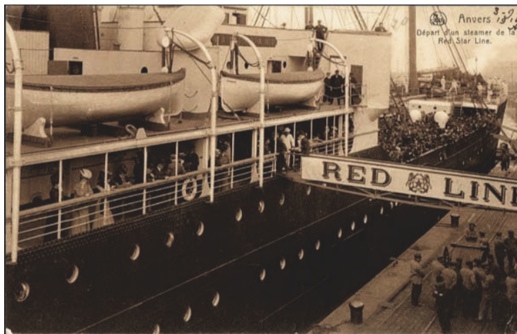
Anvers peut se targuer d'une riche histoire maritime.

La journée d'études sera organisée à l'Ecole Supérieure de Navigation, qui peut d'ailleurs revendiquer le label de patrimoine maritime en tant