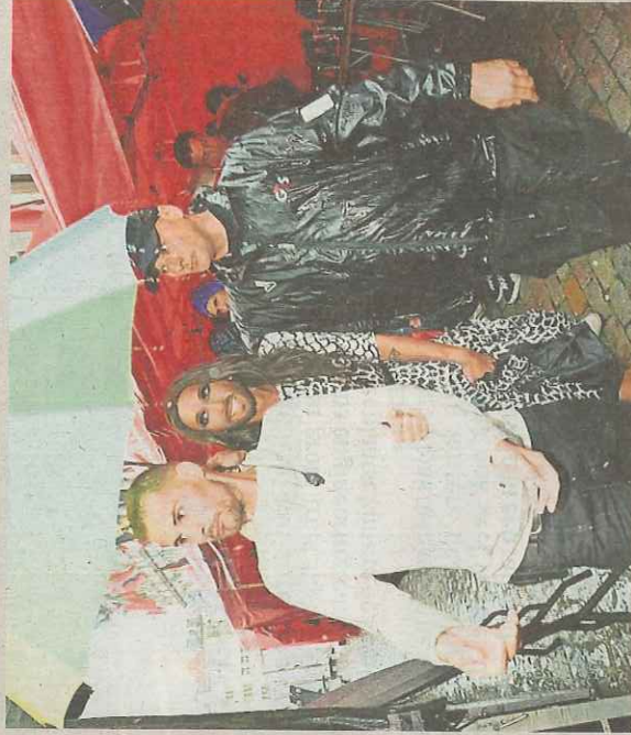
Eurosongwinnaar Conchita Wurst stapte in de gietende regen onder begeleiding naar het podium.

Feestvierders wassen hun doorweekte kleren in de wasserij aan de Grote Markt.