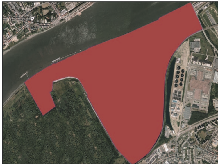
De site Petroleum Zuid krijgt een gemengde ontwikkeling.

D e 75 ha grote site zal naast een voetbalstadion ook ruimte bieden voor een watergebonden overslagfaciliteit, een bedrijventerrein voor hoogwaardige productiebedrijven en een groene corridor van 14 ha. De locatiekeuze past in de ruimtelijke afbakening van het grootstedelijk gebied Antwerpen, die de Vlaamse regering eind vorige week goedkeurde.