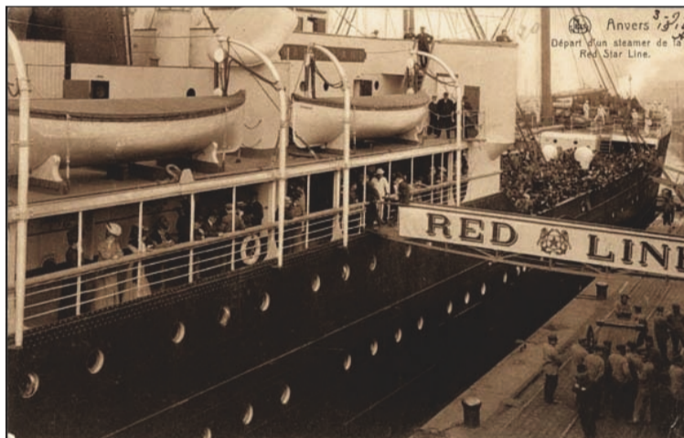
De Red Star Line is één van topprojecten inzake maritiem erfgoed.

De initiatiefnemers willen de overheid en de beleidsmakers een duidelijk signaal geven dat er wel degelijk belangstelling is voor het Antwerpse maritiem erfgoed, zodat ook privébedrijven zouden beseffen dat er zich hier een doel aandient voor sponsoring.